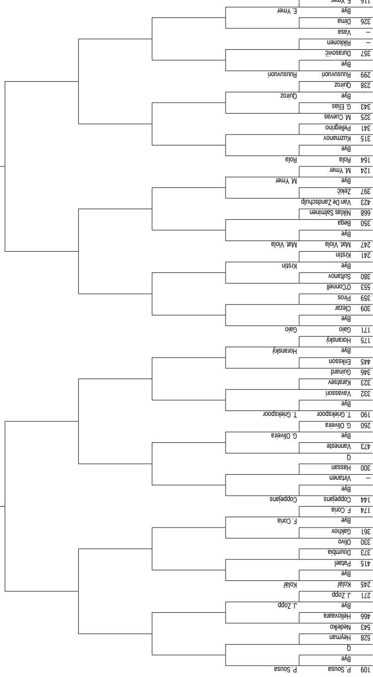
Tenis ATP Tour - Tampere, 46 600 €, antuka